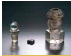
舍利・水晶舍利容器

源頼朝が生前信仰していた仏舎利を、夫人北条政子が当時高名だった松島の見仏上人に寄進し亡夫の菩提を弔わせた。