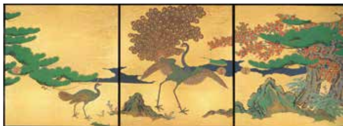
松に孔雀図(復元部分)狩野左京筆(室中孔雀の間)